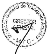
BRUNO GIUFFRA MONTEVERDE Ministro de Transportes y Comunicaciones