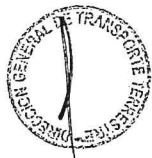
EDMER TRUJILLO MORI Ministro de Transportes y Comunicaciones