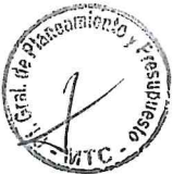
EDMER TRUJILLO MORI Ministro de Transportes y Comunicaciones