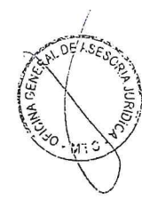
EDMÈR TRUJILLO MORI Ministro de Transportes y Comunicaciones