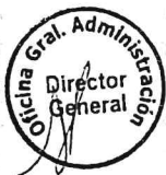
ÓSCAR TRUJILLO MORI Ministro de Transportes y Comunicaciones