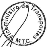
EDMER TRUJILLO MORI Ministro de Transportes y Comunicaciones