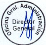
EDMÉR TRUJILLO MORI Ministro de Transportes y Comunicaciones