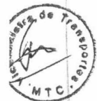
MARTÍN ALBERTO VIZCARRA CORNEJO Ministro de Transportes y Comunicaciones